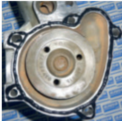
BOMBA DE AGUA

3. La tapa de culata que cierra sobre el sombrerete del árbol de levas, la tapa de cierre en el soporte del retén, etc.